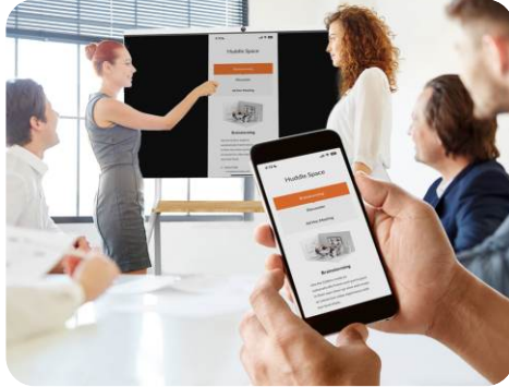
Airplay / Miracast / Chromecast