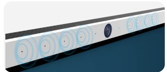
Fotocamera integrata e 8 microfoni