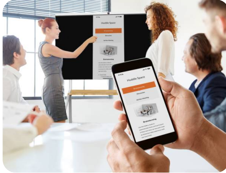
Airplay / Miracast / Chromecast