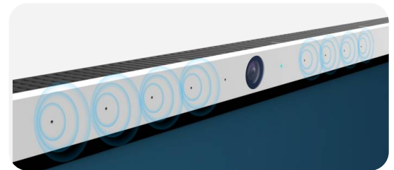
Fotocamera integrata e 8 microfoni