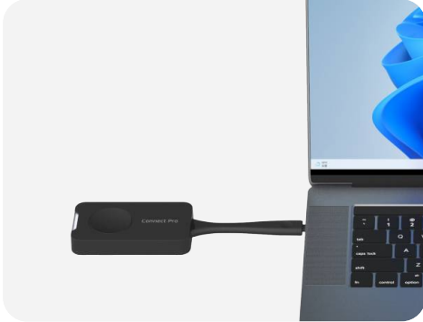
Bouton Connect Pro Plug-and-Play

Vivez une collaboration fluide avec les dongles Connect Pro, AirPlay, Miracast et Chromecast pour un partage d'écran facile. Le partage multiple permet à plusieurs utilisateurs de présenter simultanément, boostant la productivité.